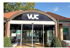
SAMARBEJDE MED VUC LYNGBY